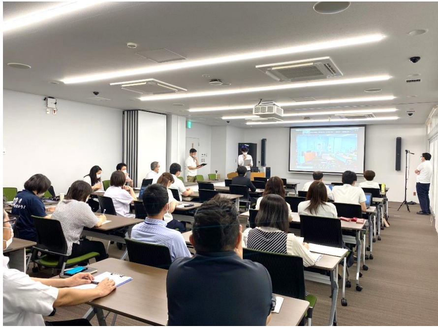
集合研修会場の様子

今回の派遣における地域情報化アドバイザーの支援の様子がわかる「写真（JPEG）」を次ページに数枚程度貼り付けて下さい。