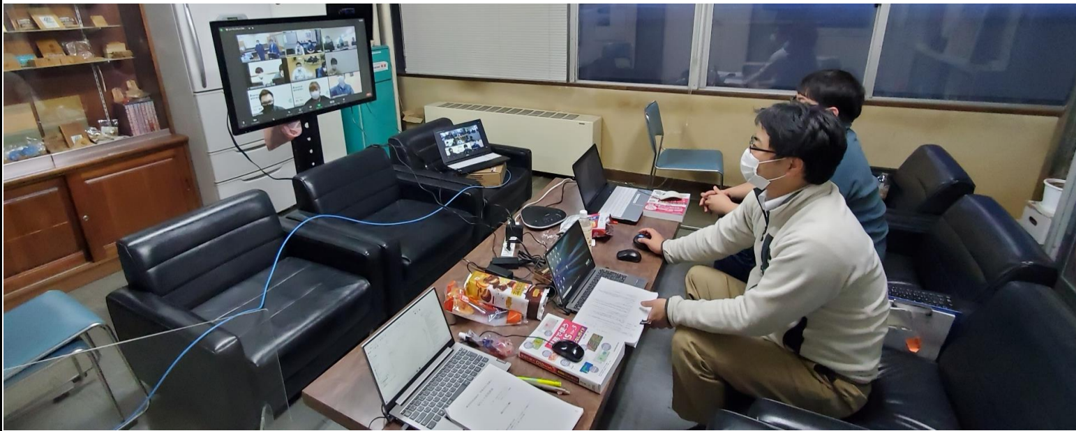
Zoomによる 開催状況 (紋別市会場)

今回の派遣における地域情報化アドバイザーの支援の様子がわかる「写真（JPEG）」を次ページに数枚程度貼り付けて下さい。