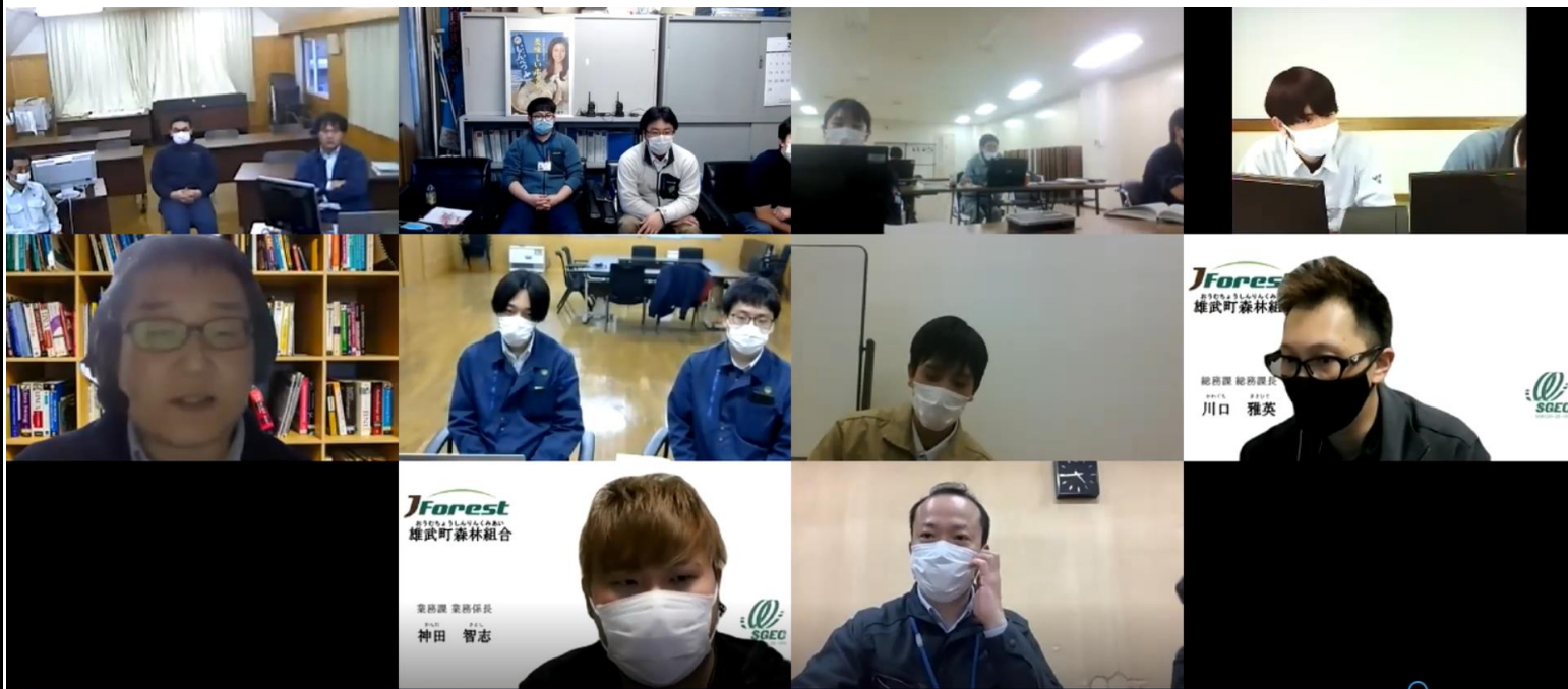
Zoomによる 各会場との中 継状況