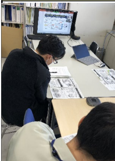
会議中(資料説明中)

今回の派遣における地域情報化アドバイザーの支援の様子がわかる「写真(JPEG)」を次ページに数枚程度貼り付けて下さい。