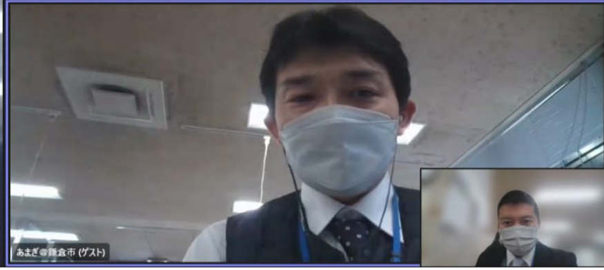
あまご 勝田鎌倉市 (ゲスト)