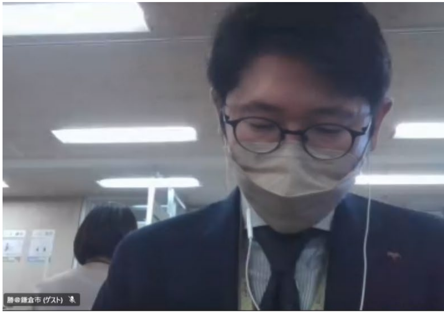
勝田鎌倉市 (ゲスト)