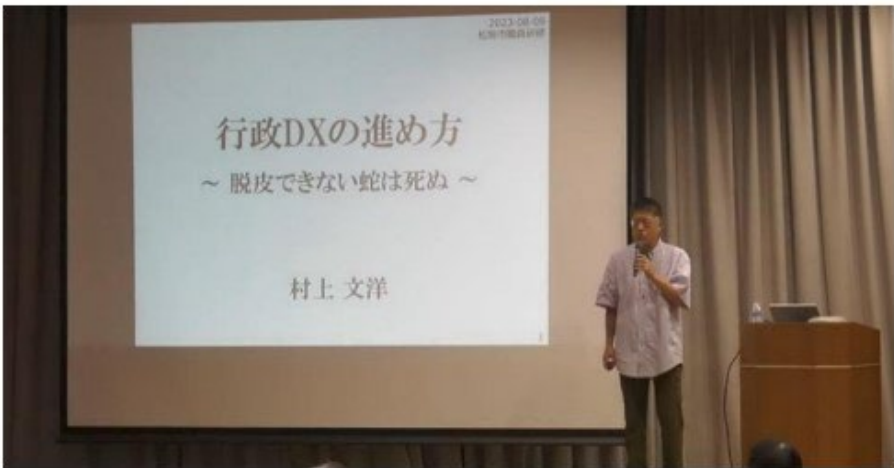
午前の部(座学のみ)

今回の派遣における地域情報化アドバイザーの支援の様子がわかる「写真(JPEG)」を次ページに数枚程度貼り付けて下さい。