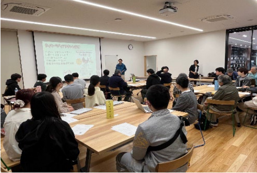
アドバイザーによる説明

今回の派遣における地域情報化アドバイザーの支援の様子がわかる「写真（JPEG等）」を数枚程度貼り付けて下さい。