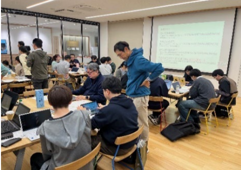
グループワーク(編集作業)