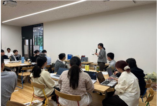
図書館からの参考文献の紹介