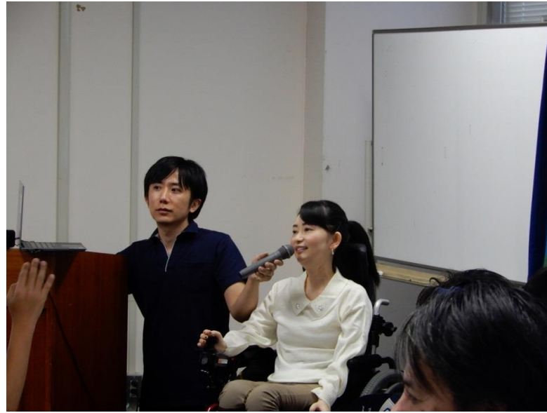
織田氏によるご講演