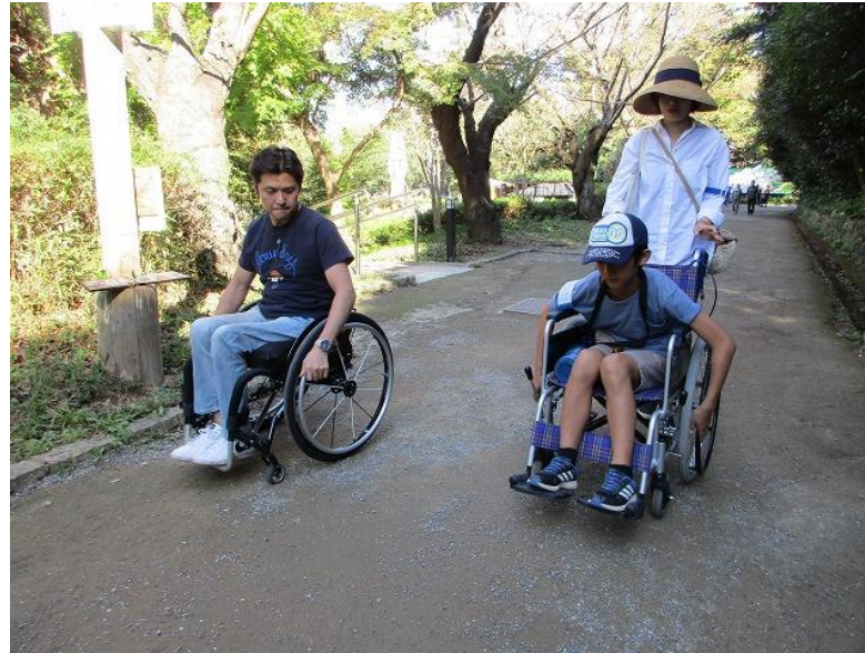
街歩き 車いすユーザーの方と