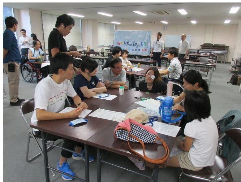
街歩き後の振り返り