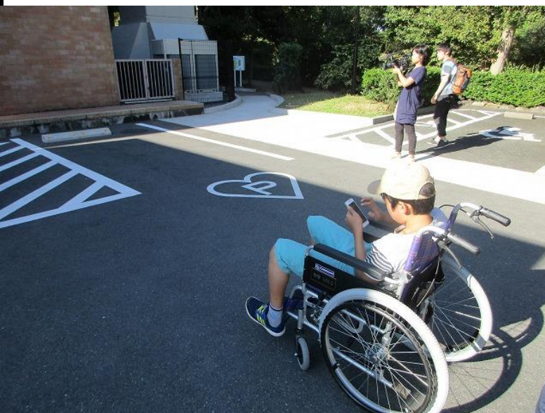
街歩き スマホで情報登録