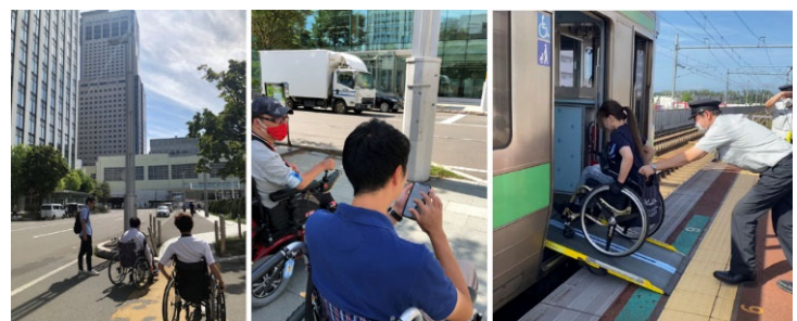
▲当日の様子（車いす街歩き）