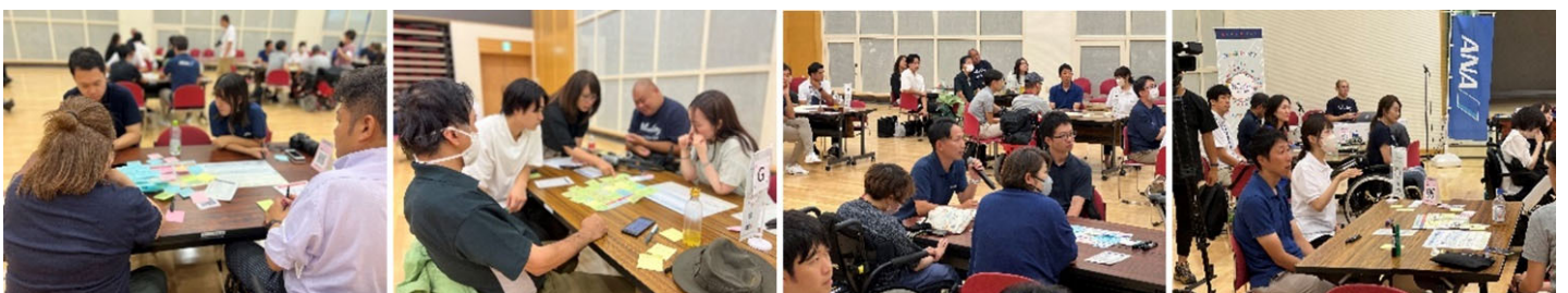
▲当日の様子（意見交換・発表）

専門家の招聘ハードルが大きく下がるため新規取組に着手しやすくなるほか、制度の活用によりアドバイザーの派遣等に要する費用を負担いただけることで、事業予算も有効活用できるのが大きな利点。要望として、アドバイザーの分野が多岐にわたり、幅広い事業での活用が可能と考えられることから、より広いチャネルを使って制度を周知いただきたい。