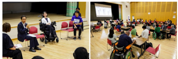
▲当日の様子（トークイベント）

これらの支援により、当日の参加者はもとより後日配信となった動画コンテンツの視聴者を含め幅広くバリアフリーの意義等を発信することができた。