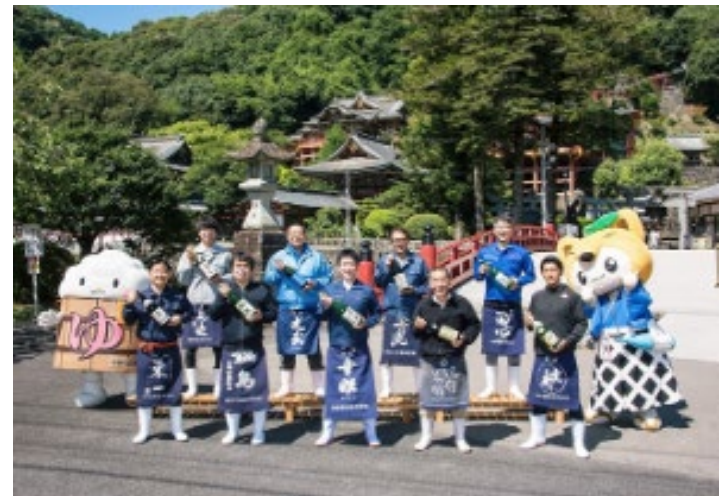
「鹿島酒蔵ツーリズム®」