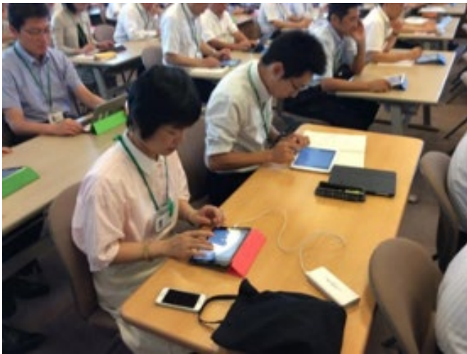
2014年 佐賀県庁でのテレワーク導入